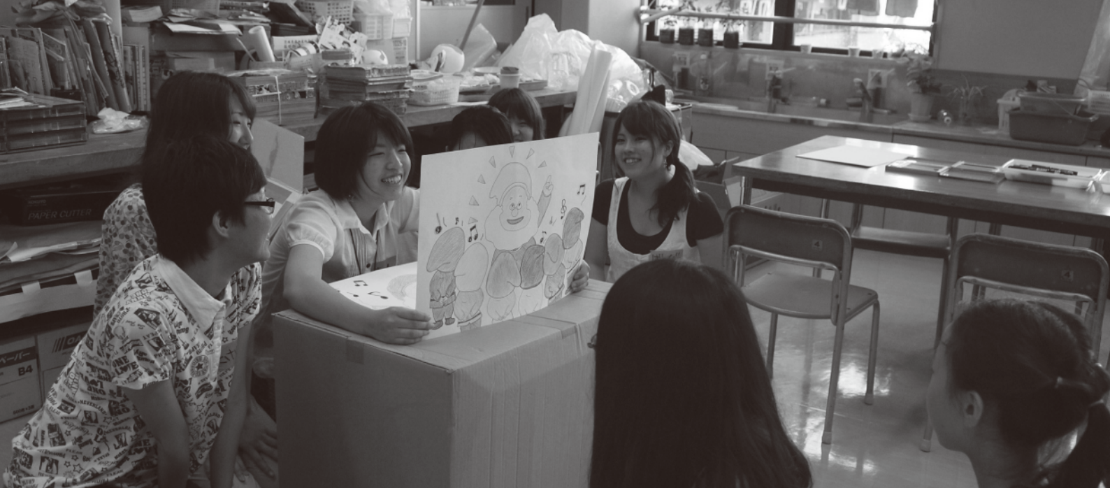
しおりプロジェクト (神田児童館) 「ぼくのわたしのすきなほん」 ワークショップ