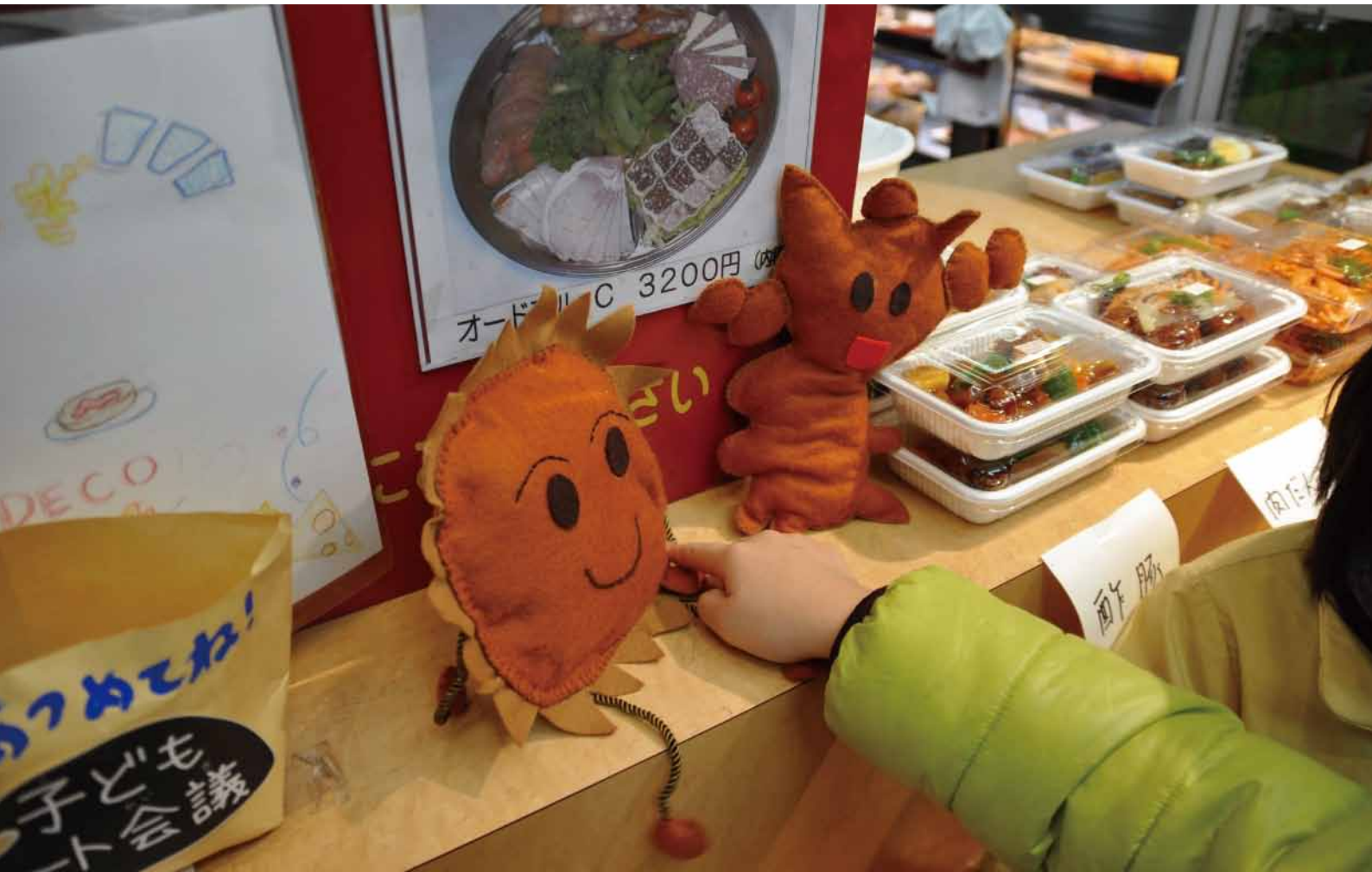
子どもアート会議(四番町児童館)で子どもたちの考えた「うちの精肉店」のマスコット・キャラクター

山脇ギャラリー 〒102-0074 東京都千代田区九段南 4-8-21 tel:03-3264-4027